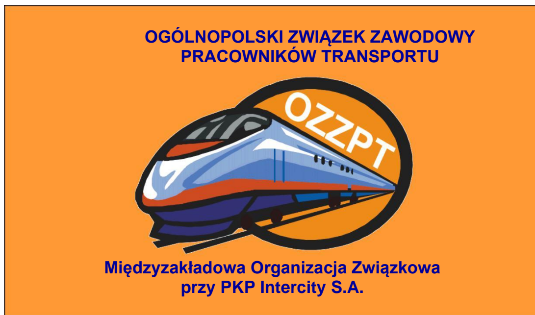
Wzór Nr 1. Flaga OZZPT – wzór miejscowy