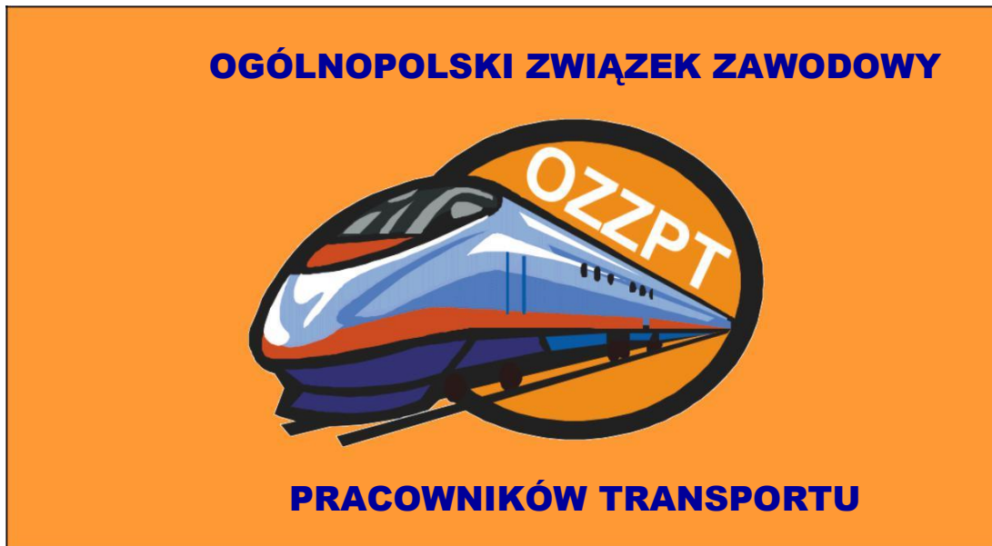
Wzór Nr 1. Flaga OZZPT – wzór ogólny