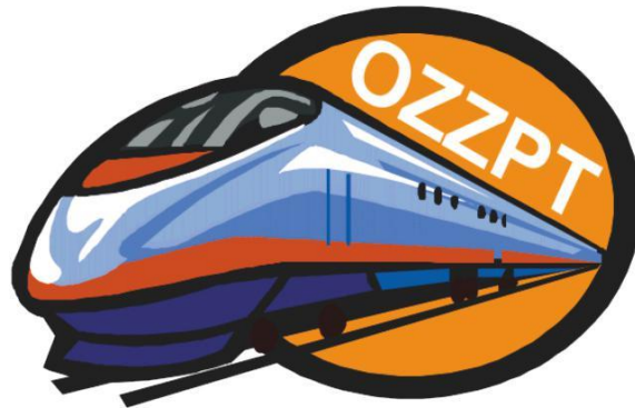
Wzór Nr 2 Logo kolorowe